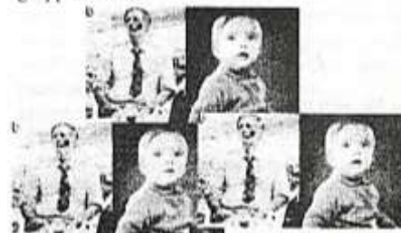
Det er redaktøren i midten.

Redaktionen består foruden redaktøren selv af et bestyrelsesmedlem fra distriktet ( ansvarsh.), en spiller fra Jyderup BK, en spiller fra Svinninge BK, et kredsbestyrelsesmedlem samt et medlem af DBF's repræsentantskab. De var alle 6 samlet til et redaktionsmøde, hvor de blev foreviget af bladets fotograf på nedenstående gruppebillede.